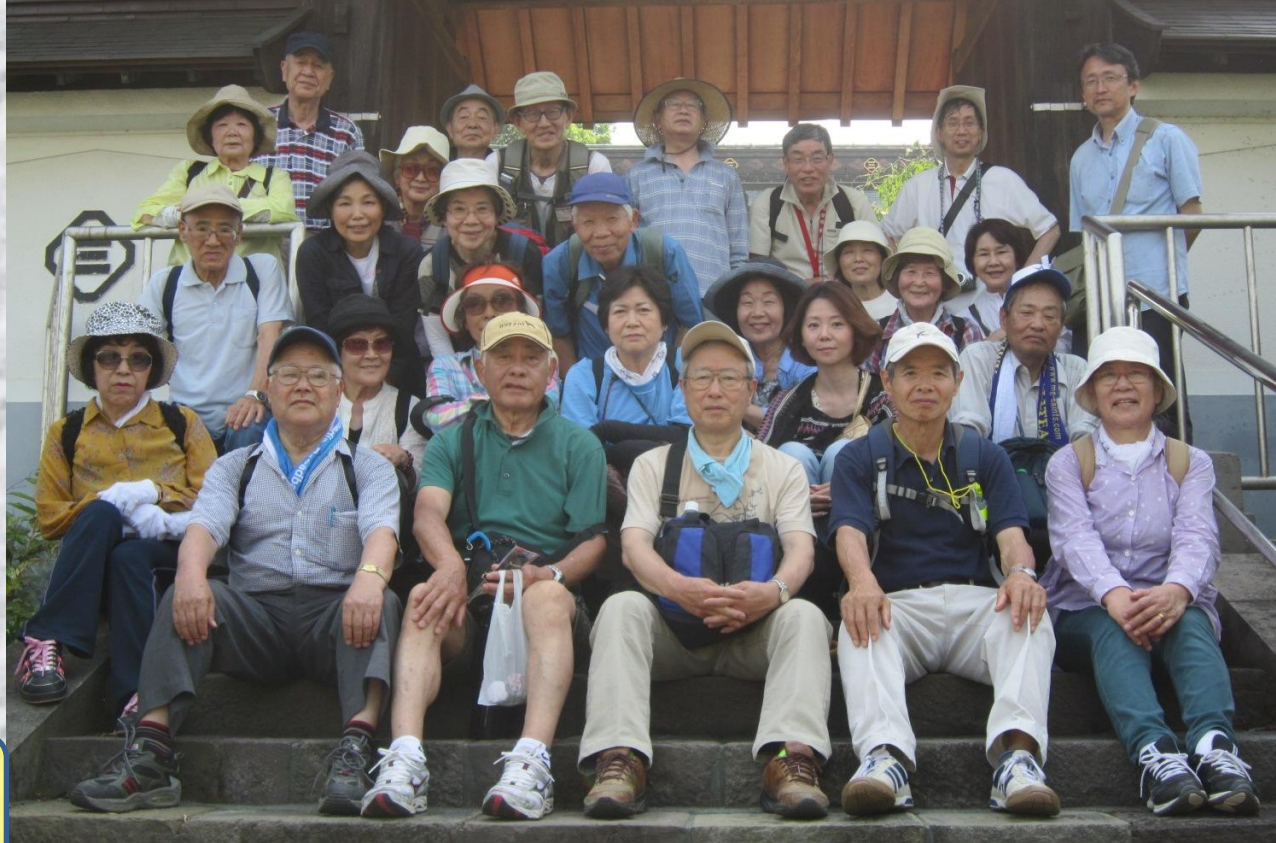
最後は抽選会を行い、親縁寺で解散しました