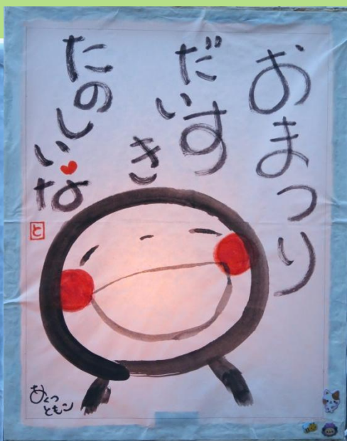
(役員投票で1位でした)