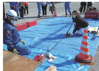
レスキュージャッキ体験

防災訓練は12時過ぎに終わり、閉会式終了後にはご参加いただいた参加者全員(町内会、自治会役員、消防団員、アマチュア無線、学校関係者、防災ライセンス、行世担当者)に、防災備蓄庫の賞味期限近い備蓄品(食料中心)の配布をさせて頂きました。