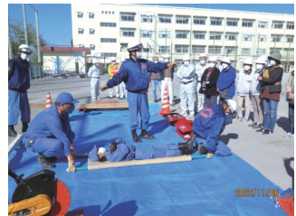
毛布を使った簡易担架

これから地域防災拠点において防災訓練を開催する旨の交信を行ない、4班に分かれて各々40分ごとに②から⑤の避難時の対応について、説明を受けたり、各人が実践的に体験する等の訓練を行いました。