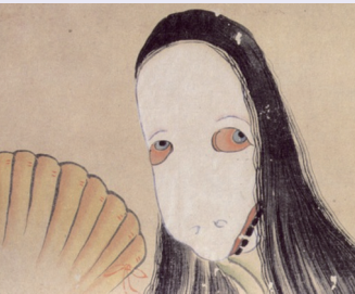
百鬼夜行絵巻の青女房

其の二 源実朝がみた青女 実朝が夜中に歌を読んでいた時、夜中、庭先に少女が走り抜けていったんだ。「どの、誰じゃ」と聞いても、答えず消えてしまった。そして松明のような明かりが現れしばらくたって消えてしまった。急いで陰陽師の阿部親職を呼んでお払いの儀式をした。その青女は「吾妻鏡」に書かれています。