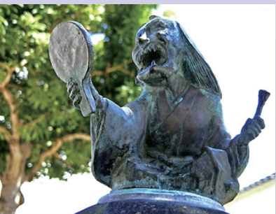
水木しげるロードの青女房像

も描かれている、境港の水木しげるロードにもプロレス像となっている。この妖怪については詳しいことはわかっていない。 其の三 九尾の狐を追撃した上総介広常(大河ドラマで佐藤浩市が演じた)であるがその後源頼朝の命で北条義時(小栗旬が演じた)が南清した。三浦介義明は衣笠城の戦いで平家方に討たれた、鎌倉幕府に貢献し義時の友人であった三浦義村(山本耕史が演じた)の祖父である。