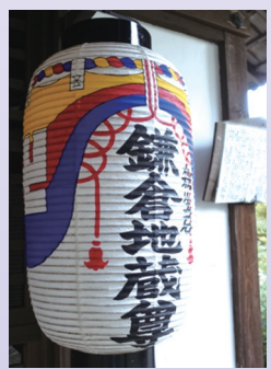
京都の鎌倉地蔵尊

の上総介広常と三浦介義明が追撃した。この後邪氣を禊する石をさらし破壊したのが玄翁和尚でその石を刻んだのが鎌倉地蔵尊で鎌倉にあったが、江戸時代に京都の三重塔西側のお堂を建て移したんだ。