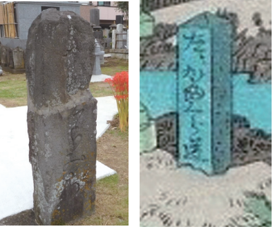
「左りかまくら道」の道標。東海道五十三次「戸塚」に描かれ、吉田町妙秀寺に現存する。

「かまくら道」とよばれている。戸塚区には上道と中道があり、中道の支線の一つに下倉田を通っている「かまくら道」がある。この「かまくら道」は東海道の吉田大橋より柏尾川沿いに分岐し蔵田寺前、南谷の大わらじ、栄区の貝殻坂、笠間十字路を経て鎌倉へと向かう。